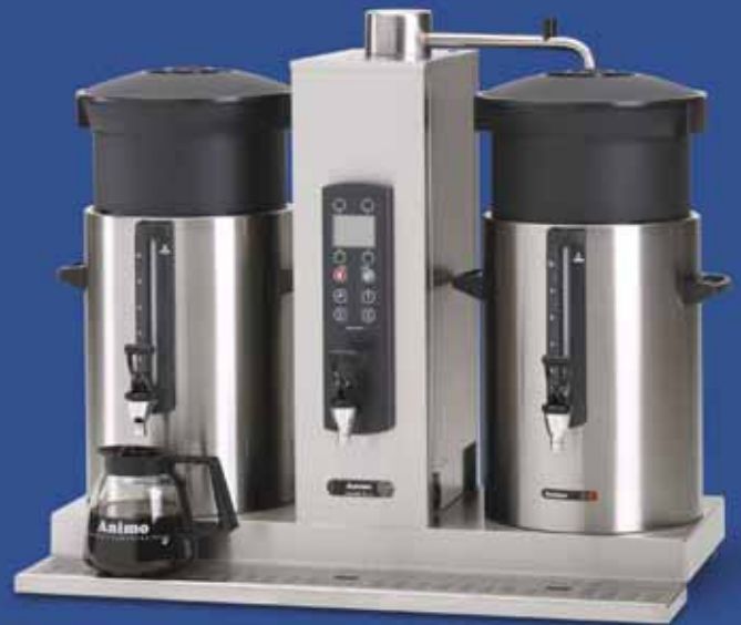
ComBi-line met twee containers van 10 liter en separate waterkoker in de zuil: CB 2x10W.