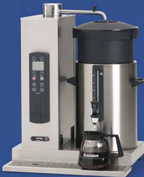
ComBi-line met een rechts geplaatste container van 10 liter: CB 1x10 R.