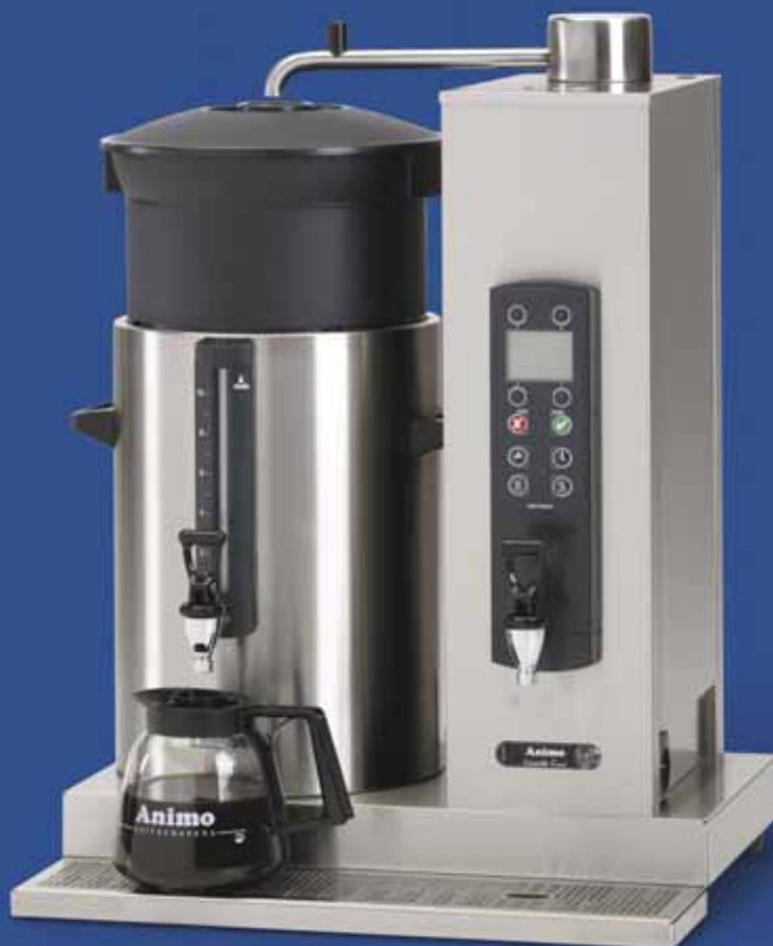
ComBi-line met een links geplaatste container van 10 liter en separate waterkoker in de zuil: CB 1x10W L.

Naast deze gebruikersinstellingen geeft het bedieningspaneel ook toegang tot de operator- en serviceomgeving. Deze laatste twee zijn alleen te bedienen met een pincode. U vindt er de instellingen voor het beheersen van het koffiezetproces, voor de gescheiden waterkoker en voor service en onderhoud.