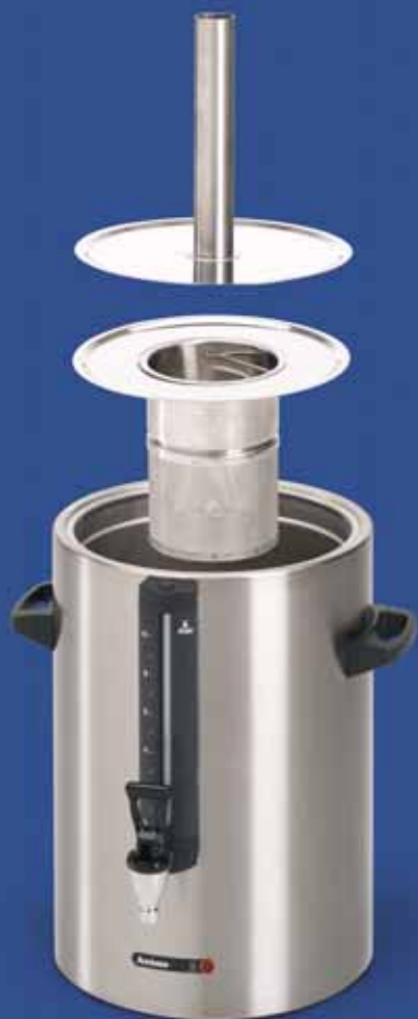
Voor het zetten van thee in een container plaatst u het speciale theefilter met vulpijp.