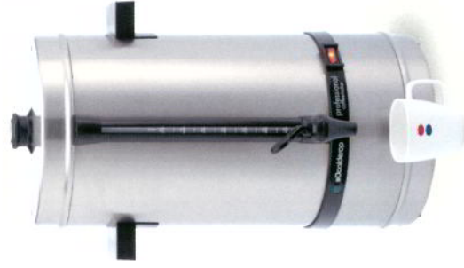
Professional 80P / 80PWW