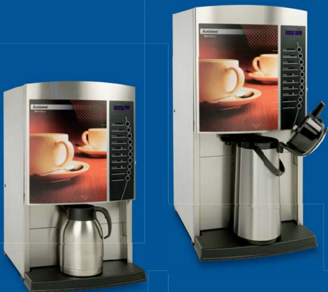
TS/TL; thermosmodellen zijn verkrijgbaar met één, drie of vier canisters t.b.v. instant ingrediënten.

Binnen de OptiVend range zijn er tevens varianten voor kleine en grote thermoskannen. Deze thermosmodellen hebben één, drie en vier canisters en een uitschuifbaar plateau, zodat ook kopjes getapt kunnen worden.