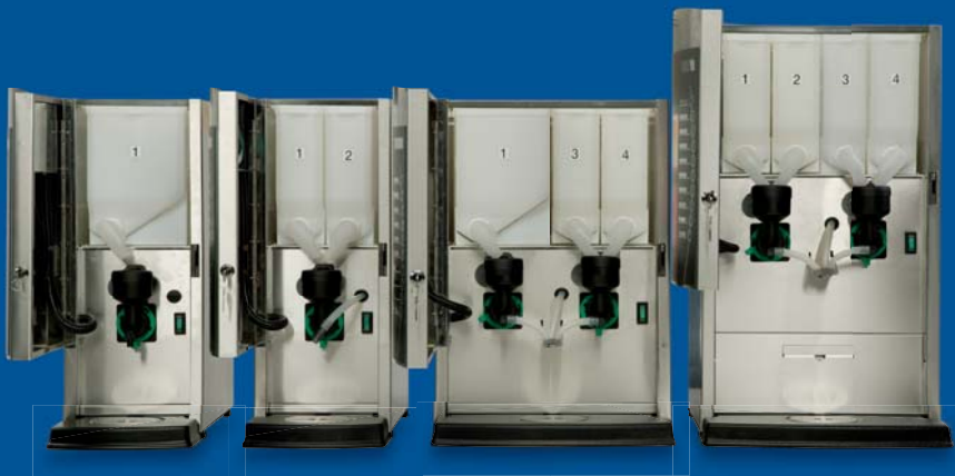
Variatiemogelijkheden hangen af van het aantal canisters.

apparaten ook heet water worden getapt. Er zijn twee smalle versies van de OptiVend: een uitvoering met één canister en een uitvoering met twee canisters. Deze smalle apparaten nemen weinig ruimte in beslag en zijn derhalve nagenoeg overal te plaatsen. De modellen met drie of vier containers zijn breder, maar bieden ook meer keuzemogelijkheden.