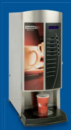
▲ OptiVend 1 / 2; smalle uitvoering met 1 of 2 ingrediënten-canisters.