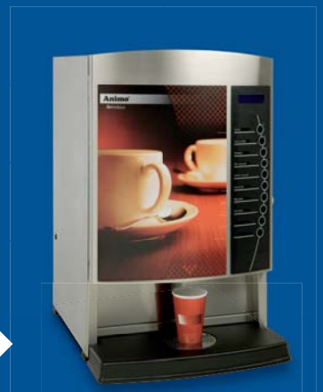
▶ OptiVend 3 / 4; brede uitvoering met 3 of 4 ingrediënten-canisters.