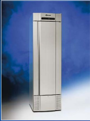
MIDI 425 CX