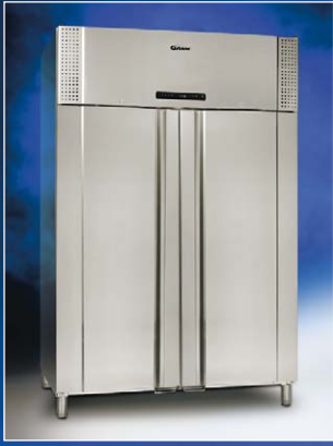
PLUS 1400 CX