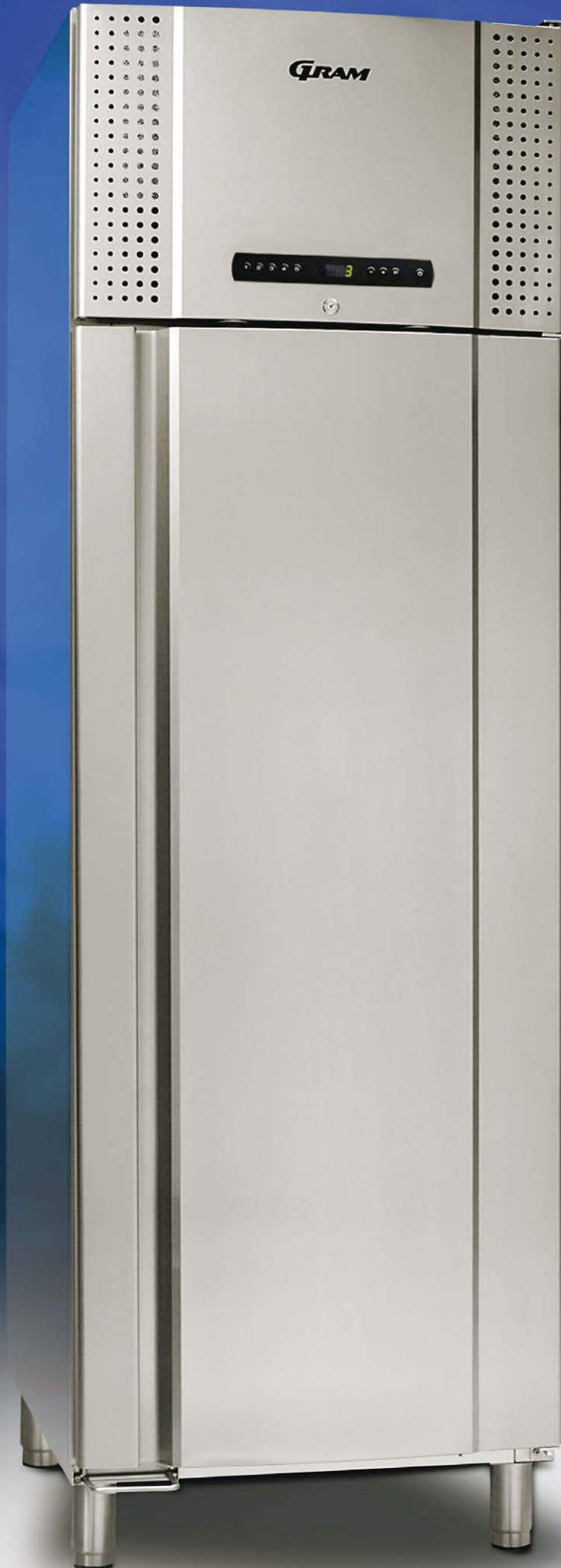
PLUS 660 CX