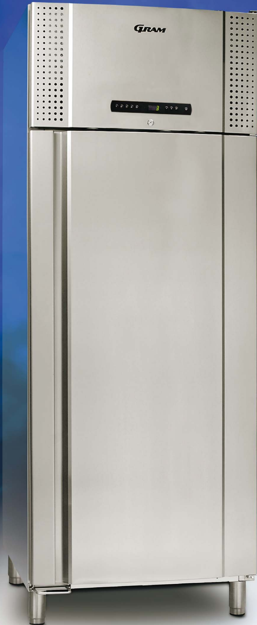
TWIN 660 CX