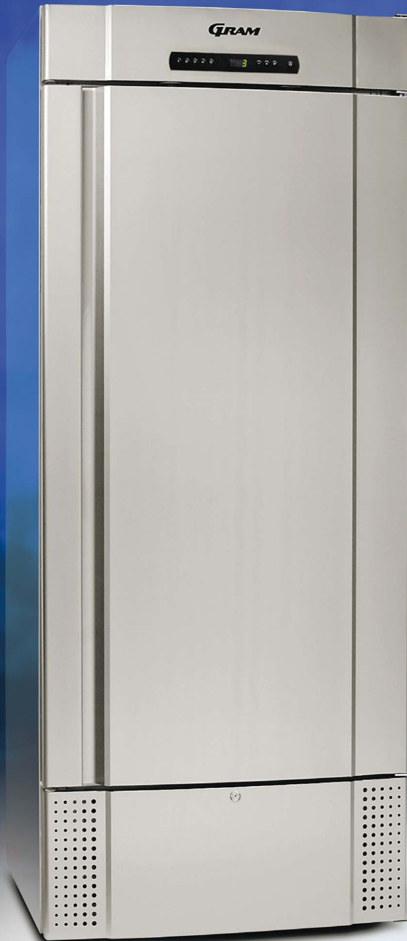
MIDI 625 CX