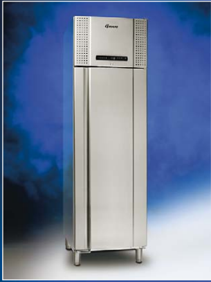
EURO 500 CX