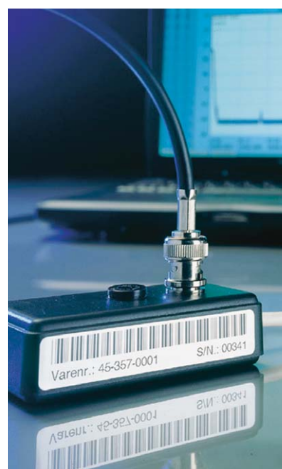
Gram Data Logger