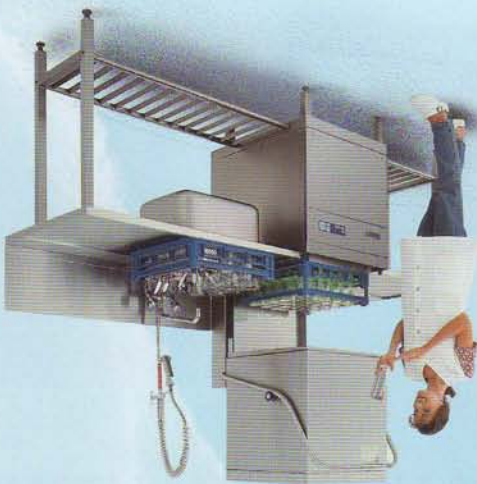
MEIKO DV 40.

Grote doorvoerhoogte, vederlichte heflijn, krachtig draaiend was- en spoel-systeem met een effectieve werking. Dit zijn de kenmerken voor de hoge capaciteit tot 1080 borden / 60 korven per uur. Door het beladen vanaf 3 zijden onbegrensde opstel- en plaatsmogelijkheden.