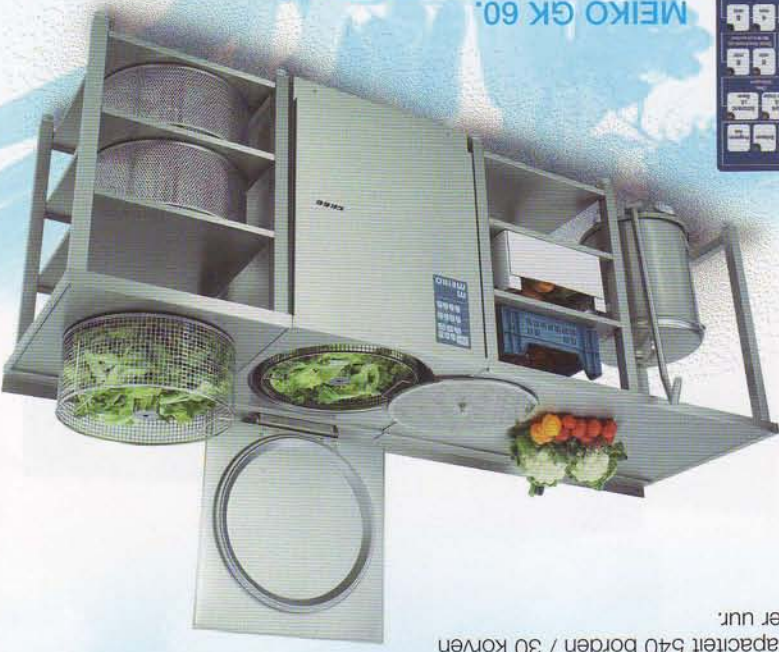
MEIKO GK 60.

De economische overstap naar de praktische doorschuifmodellen voor de kleine tot middelgrote Gastronomie. Aan drie zijden te beladen, met veelzijdige opstel mogelijkheden. Capaciteit 540 borden / 30 korven per uur.